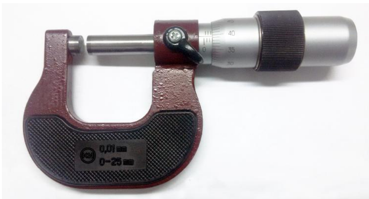
Рисунок 1 - Общий вид микрометра МК