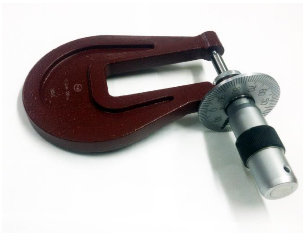
Рисунок 4 - Общий вид микрометров МЛ