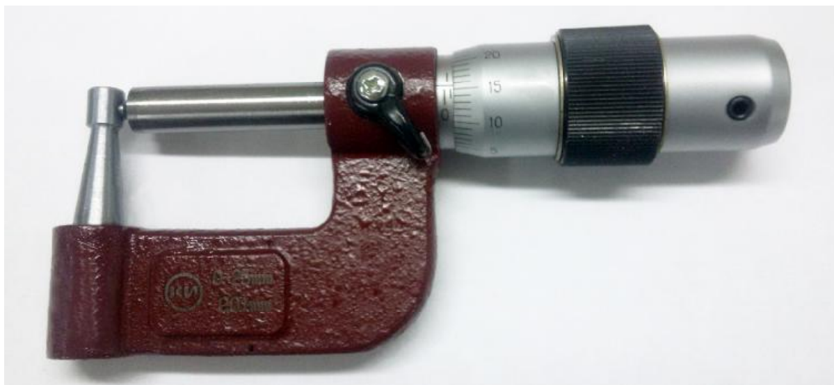
Рисунок 3 – Общий вид микрометров МТ