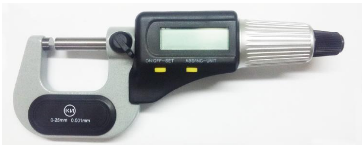
Рисунок 2 - Общий вид микрометра МК Ц