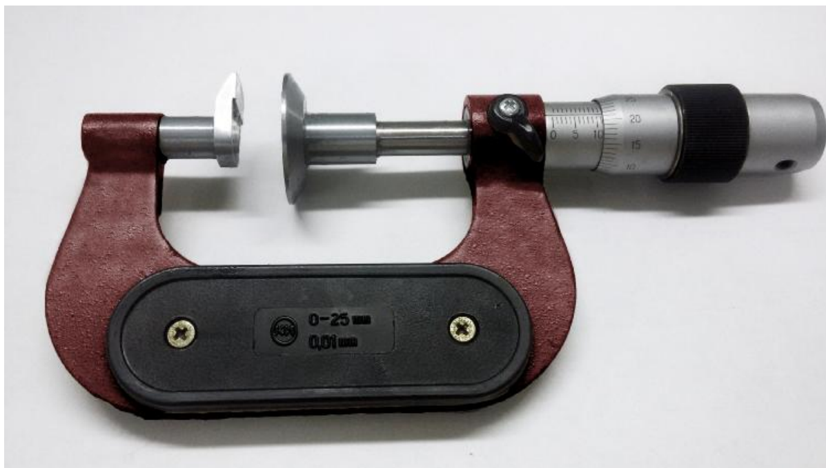
Рисунок 5 – Общий вид микрометров МЗ

Микрометры выпускаются под торговой маркой «АО КЗ «Красный инструментальщик»».